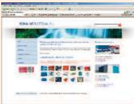
Tubos y Accesorios REKALDE BILTEGIA, S.L. http://www.rekalde.com/

Empezaremos por Rekalde, destacar que 7 de ellos, hacen referencia a personas que se apellidan así, ya sea como páginas personales o artículos referidos a las mismas. Tenemos por ejemplo un fotógrafo de Torrelavega, una profesora de Zaragoza, un diputado argentino y un almirante bilbaíno del siglo XVI. Otro de ellos hace referencia a una localidad vizcaína cercana a Güeñes de la cual desconocía su existencia. Solo en dos de ellas acertamos, eso sí, por lo menos están en primer y tercer puesto, un artículo en wikiped-