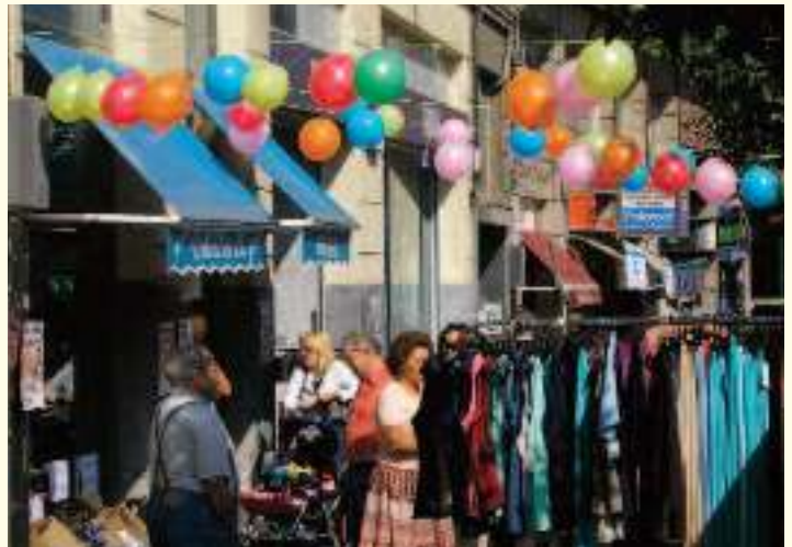
El colorido y la animación a lo largo de los dos días fueron la nota más destacada en la primera Feria de Gangas de Rekalde

Desde la Asociación de Comerciantes REKALDE BIHOTZEAN queremos agradecer a todos los clientes, vecinos y visitantes del barrio su asistencia y la gran aceptación de esta iniciativa, y les emplazamos a repetirla en un futuro.