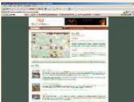
Pueblo de Rekalde, encontrado en: www.mispueblos.es/pais_vasco/vizcaya/rekalde/

Un fotógrafo de Torrelavega, una profesora de Zaragoza, un diputado argentino y un almirante bilbaíno responden por el nombre de Rekalde en Internet