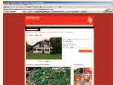
Casa rural "errekalde", en: http://casasrurales.atrapalo.com/