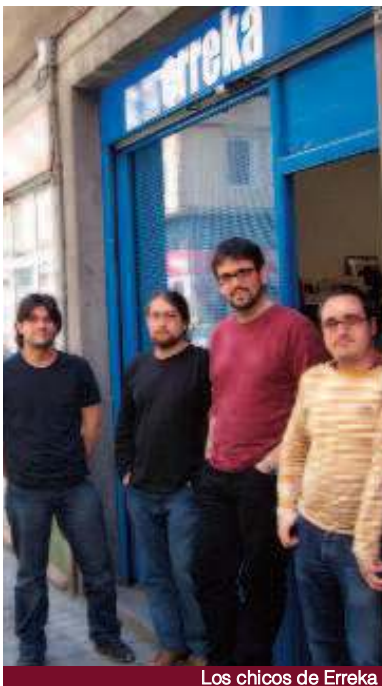
Los chicos de Erreka

Se consideran basicamente una empresa de servicios, pero creen importante mantener sus puertas abiertas al barrio.